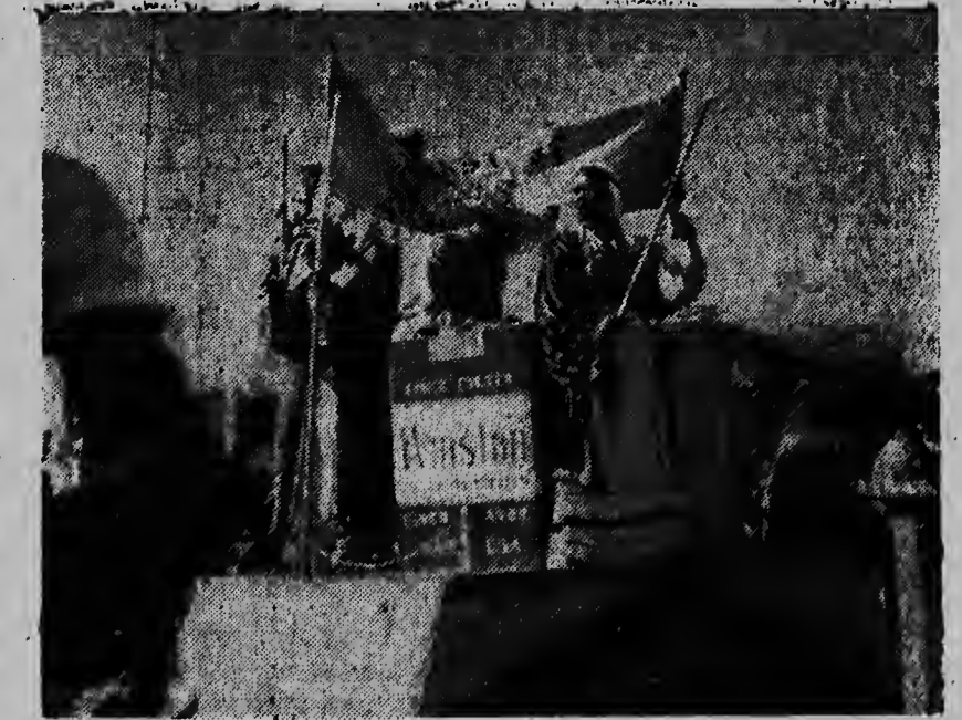
dorna di tres diferente marconan di sigario, cuol tur tres tombe ta competidor di otro, pero cu tabata sabi di pone e concurrencia riba un plano asina oita cu tur tres a biro bardadero obra maestro di propaganda.